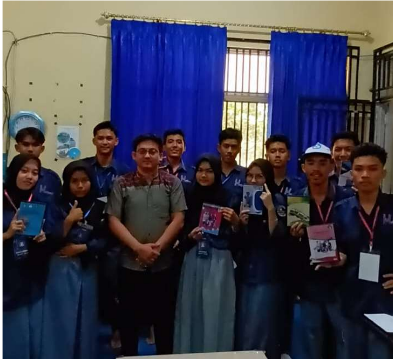
Gambar 1. Pelatihan Video Editing