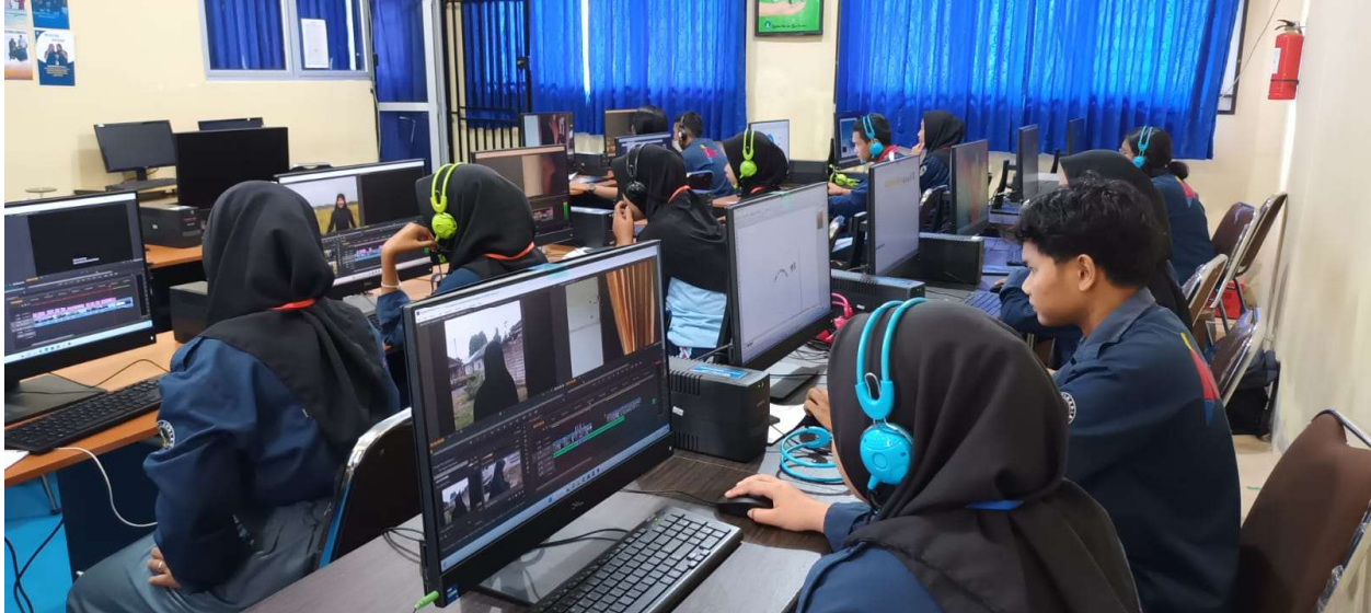
Gambar 2. Praktikum Video Editing oleh Siswa SMKN1 Tempilang

Pelaksanaan pengabdian ini dilaksanakan selama 5 hari dengan rincian setiap hari beda grup. Dimana terdapat 5 grup, masing-masing grup beda orang dari kelas XII Jurusan Multimedia.