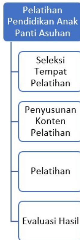
Gambar 1. Tahapan Pelaksanaan Kegiatan Pengabdian Masyarakat[8]

Selesai melaksanakan pelatihan, dilaksanakan evaluasi terhadap kegiatan tersebut. Evaluasi diukur dari pemahaman para peserta menerima materi dan keaktifan selamat mengikuti pelatihan. Hasil evaluasi mampu memberikan gambaran menyeluruh tentang sejauh mana materi pelatihan dipahami anak, bagaimana metode yang digunakan mendukung proses belajar, serta dampak jangka panjang terhadap perubahan perilaku atau peningkatan keterampilan[7].