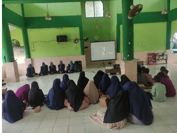
Gambar 1. Pelaksanaan Pelatihan

Melalui aktivitas ini, anak-anak belajar secara tidak langsung sambil bermain, berinteraksi, dan bekerja sama. Selain meningkatkan daya ingat dan keterampilan sosial, permainan edukatif juga membantu menumbuhkan rasa percaya diri, keberanian mengemukakan pendapat, serta kemampuan memecahkan masalah. Fasilitator berperan penting dalam mengarahkan jalannya permainan agar tetap fokus pada tujuan pembelajaran. Dengan metode ini, anak-anak tidak hanya memperoleh ilmu, tetapi juga pengalaman belajar yang menyenangkan dan membekas