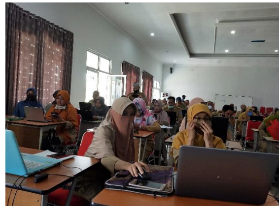
Gambar 3. Pelatihan Hari Pertama