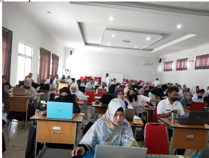
Gambar 1. Pelatihan Praktikum Secara Langsung Media Pembelajaran

Pelatihan ini dilakukan dengan metode Praktikum secara langsung di aula SMK Negeri 2 Pangkalpinang (lihat pada gambar 1). Kegiatan pengabdian ini dilaksanakan selama dua hari yaitu Selasa dan Rabu pada tanggal 18-19 Agustus 2020 dengan mengikuti protocol kesehatan covid-19.