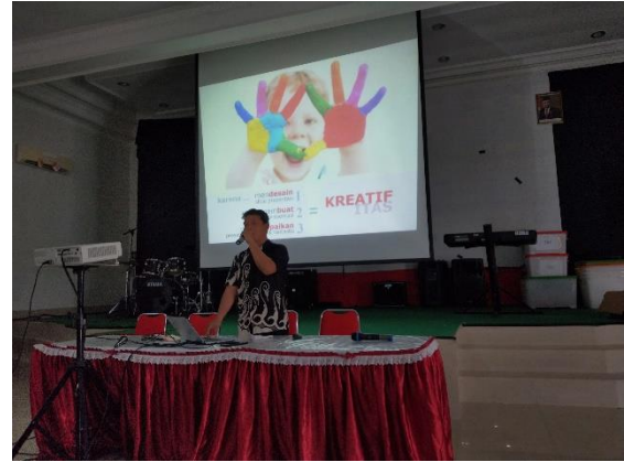
Gambar 4. Pelatihan Hari Kedua

Pelatihan ini menghasilkan powerpoint show dan video dengan extension mp4. Pelatihan ini sebagai bekal pembuatan materi pembelajaran untuk para guru.