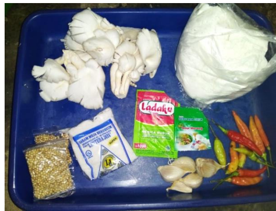
Gambar 4 : Bahan dan Bumbu Jamur Krispi

Dalam proses pembuatan jamur krispi dan jamur geprek ini, kami membutuhkan ada bahan bahan dan peralatan untuk membuatnya yakni sebagai berikut: jamur, tepung terigu, ladaku (merica bubuk), garam, ketumbar, bawang, cabai, bubuk kaldu, minyak goreng, wajan, kompor.