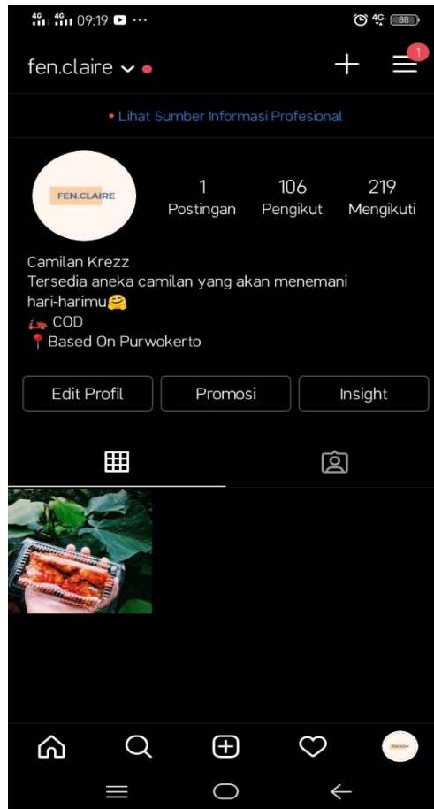
Gambar 3 : Akun Instagram FEN Claire

Dalam pelaksanaan bisnis produk Jamur Krispi FEN Claire telah mengumpulkan sebanyak 106 follower dalam instagram bahkan sebelum produk dikenalkan kepada masyarakat. Namun terdapat hambatan yaitu kurangnya pengenalan produk pada konsumen mengakibatkan bisnis tidak berjalan dengan lancar. Dengan hanya mengandalkan instagram sebagai media promosi tentu hal itu sebenarnya sudah cukup efektif dalam memasarkan produk namun akan lebih efektif jika menggunakan media sosial yang lainnya misalnya Facebook untuk pengenalan dan pemasaran produk. Pada saat ini Facebook bukan hanya digunakan sebagai media komunikasi melainkan terdapat fitur marketplace yang bisa dimanfaatkan oleh para pebisnis. Di marketplace ini para pebisnis dapat memasarkan produknya agar lebih dikenal luas oleh masyarakat khususnya untuk masyarakat yang tidak memiliki akun instagram. Marketplace Facebook awalnya didirikan pada tahun 2007 dan terus dikembangkan dalam bentuk fitur yang lebih sempurna pada tahun 2016 dan pada tahun 2018 jumlah pengguna marketplace mulai bertambah dan semakin ramai penggunaannya pada tahun 2019 dalam layanan yang ada pada fitur Facebook di dalamnya menyediakan penyetingan akun penjual, dan button pilihan ingin memasarkan produk dan jenis