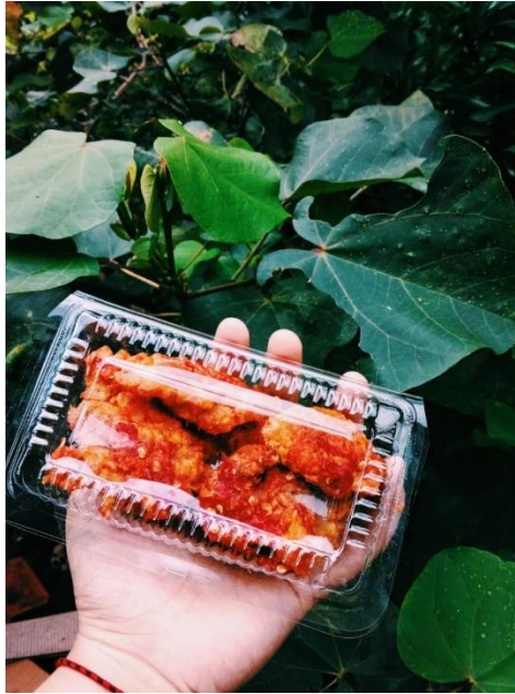
Gambar 5 : Jamur Krispi Geprek