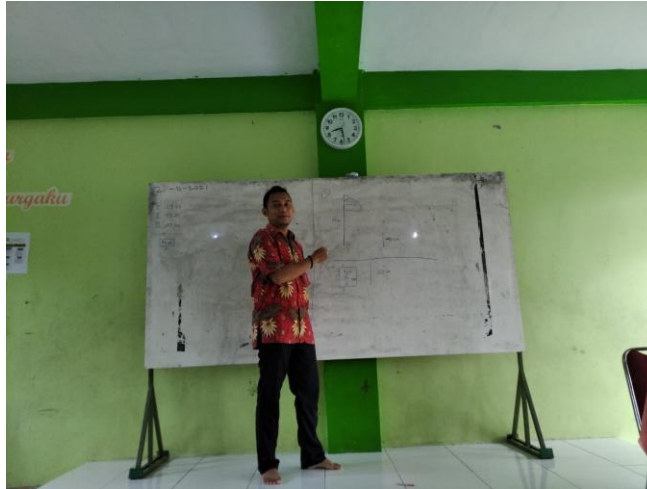
Gambar 2. Tim memberikan penjelasan di salah satu pertemuan

Selanjutnya, Tim memberikan pelatihan sebanyak 8 kali pertemuan. Topik yang diberikan juga seputar topik teori bilangan.