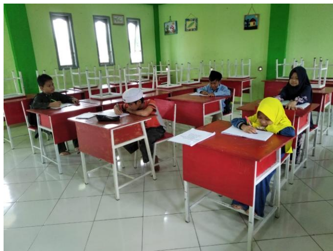
Gambar 1. Peserta mengerjakan pretest

Kegiatan pelatihan ini diikuti oleh 6 peserta dengan rincian 3 peserta kelas 4 dan 3 peserta kelas 5. Pada tahap awal, Tim memberikan soal pretest. Hasil pretest menunjukkan rata-rata kemampuan matematika siswa dalam mengerjakan soal olimpiade adalah 15.