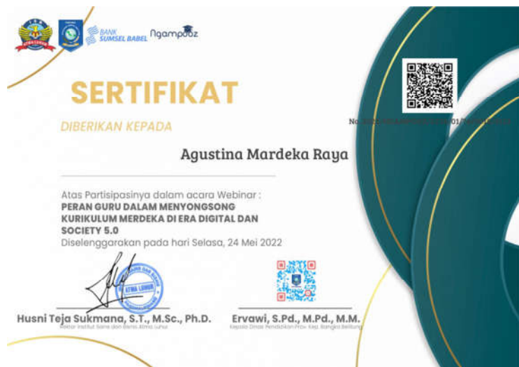
Gambar 3. Gambar Sertifikat Kegiatan