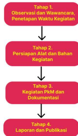
Gambar 1. Metode Pelaksanaan PkM

Metode Pelaksanaan akan diadakan menjadi 4 tahap : Tahap 1. Observasi dan wawancara penetapan waktu kegiatan, tahap 2. Persiapan alat dan bahan kegiatan, tahap 3. Kegiatan PkM dan Dokumentasi, tahap 4. Laporan dan Publikasi.