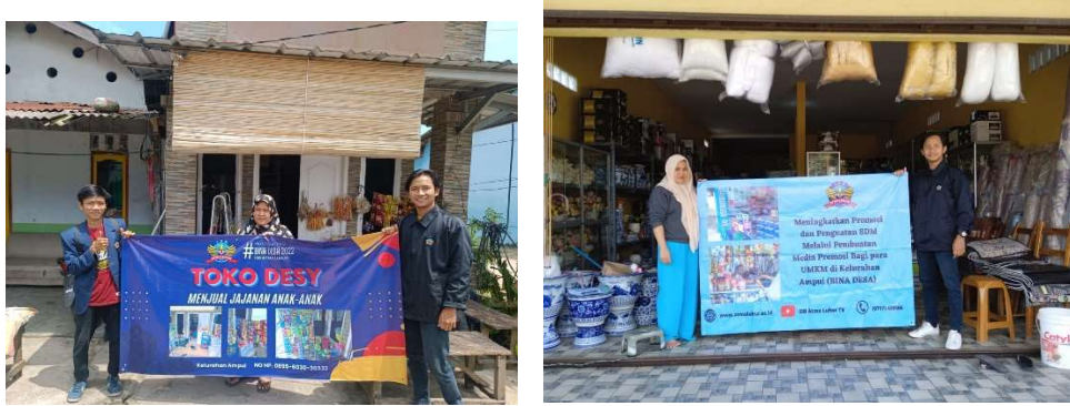
Gambar 3. Hasil Cetakn Spanduk untuk para UMKM