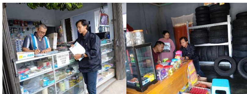
Gambar 2 . Pendataan dan Pendampingan Pembuatan Promotion Tools